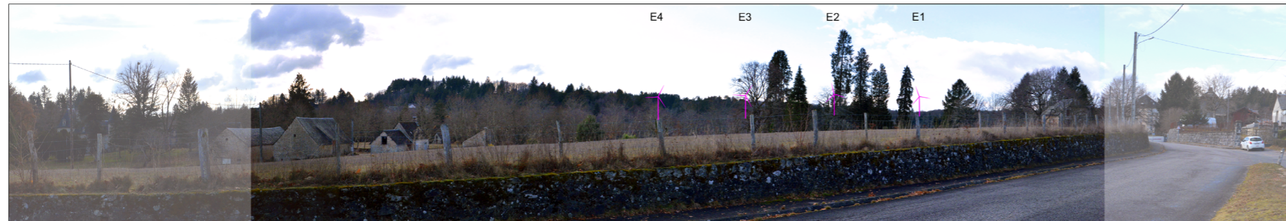
Vue panoramique avec esquisse (angle de vue de 90°)