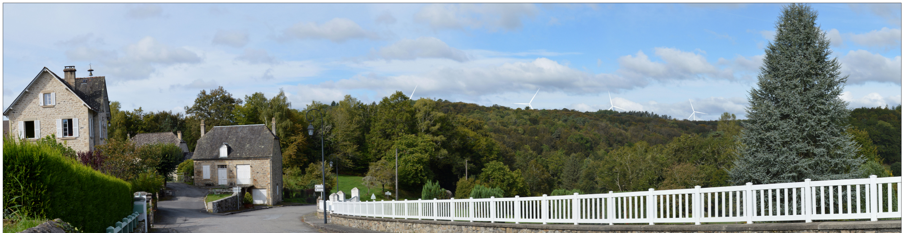
Le photomontage doit être observé à une distance de 35cm pour correspondre à une vue réaliste (impression A3).