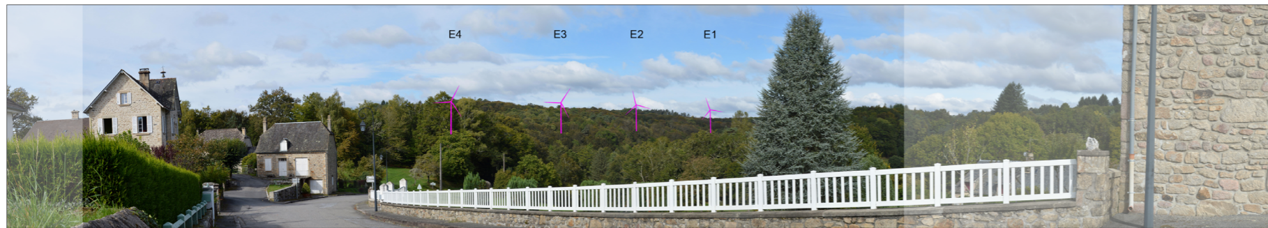
Vue réaliste avec photomontage (angle de vue 60°)