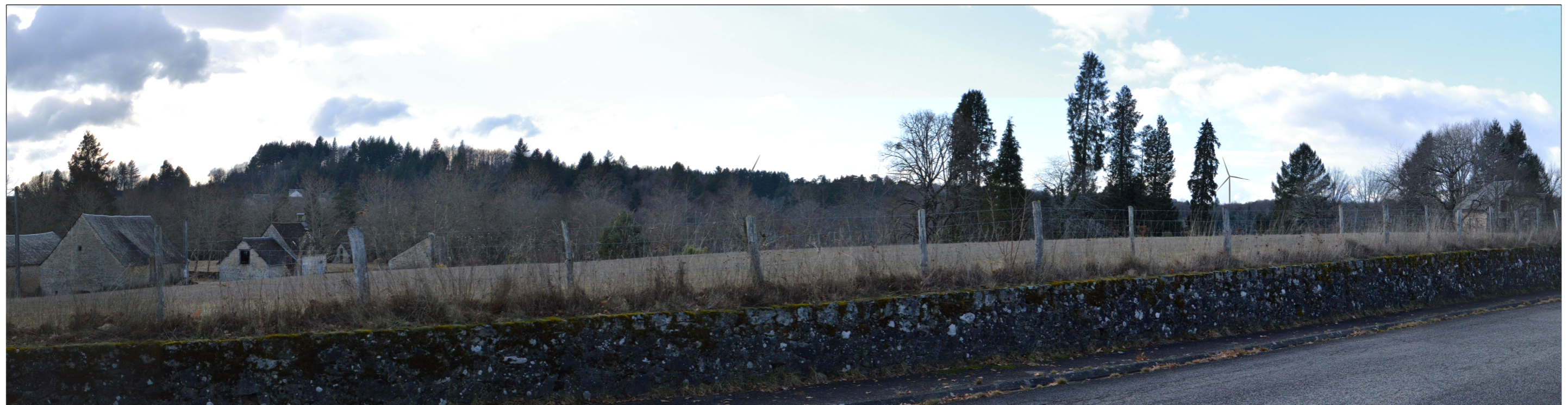
Vue réaliste avec photomontage (angle de vue 60°)

Le photomontage doit être observé à une distance de 35cm pour correspondre à une vue réaliste (impression A3).